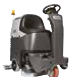
BR752 Поломоечные машины