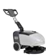
SC351 Поломоечные машины