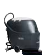
SC430 Поломоечные машины