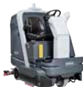
SC6000 Поломоечные машины