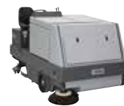
CR1500 Комбинированные машины