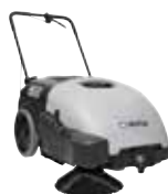
SW750 Подметальные машины