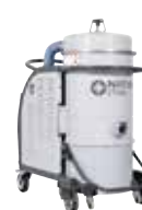
CTS22/40/CTT40 Промышленные пылесосы