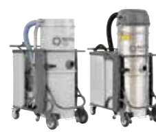
T & Tplus Промышленные пылесосы