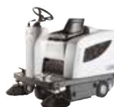
SR1101 Подметальные машины