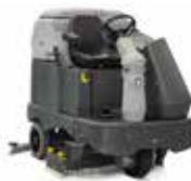
SC6500 Поломоечные машины