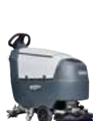
SC401 Поломоечные машины