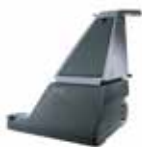
GU700A Коммерческие пылесосы