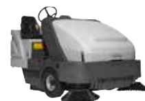
SR1601 Подметальные машины