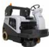
SW5500 Подметальные машины