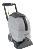
ES300 Ковровые экстракторы