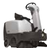
SR1000S Подметальные машины