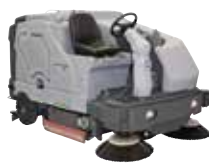
SC8000 Поломоечные машины