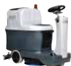
SC2000 Поломоечные машины