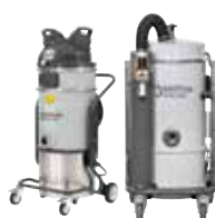
VHC110-VHC200 Промышленные пылесосы