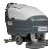
SC800 Поломоечные машины