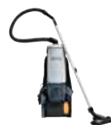
GD5 Battery Коммерческие пылесосы