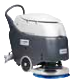
SC450 Поломоечные машины