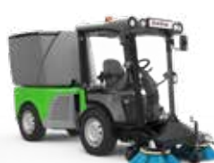
CITY RANGER 3070 Коммунальные машины