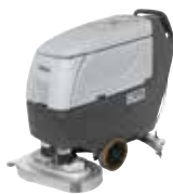
BA/CA 551 Поломоечные машины