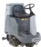
BR755/755C/855 Поломоечные машины