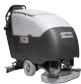
BA651 Поломоечные машины