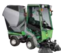
PARK RANGER 2150 Коммунальные машины