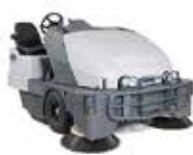
SW8000 Подметальные машины