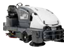
CS7010 Комбинированные машины