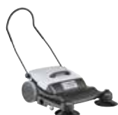
SW200/250 Подметальные машины