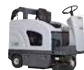
SW4000 Подметальные машины