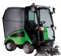
CITY RANGER 2250 Коммунальные машины