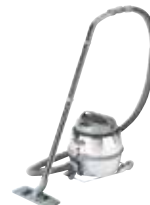
GM80P Промышленные пылесосы