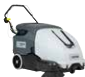
SW900 Подметальные машины