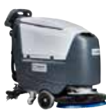
SC500 Поломоечные машины