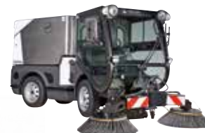
CITY RANGER 3500/3570 Коммунальные машины